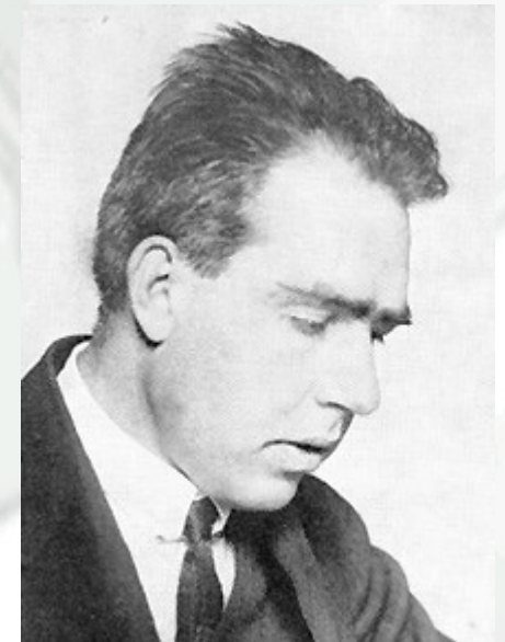
Niels Bohr, em editorial em jornal londrino

“A civilização se encontra ante um desafio mais sério do que jamais esteve, e o destino da humanidade dependerá da sua capacidade de unir suas forças diante da ameaça comum”