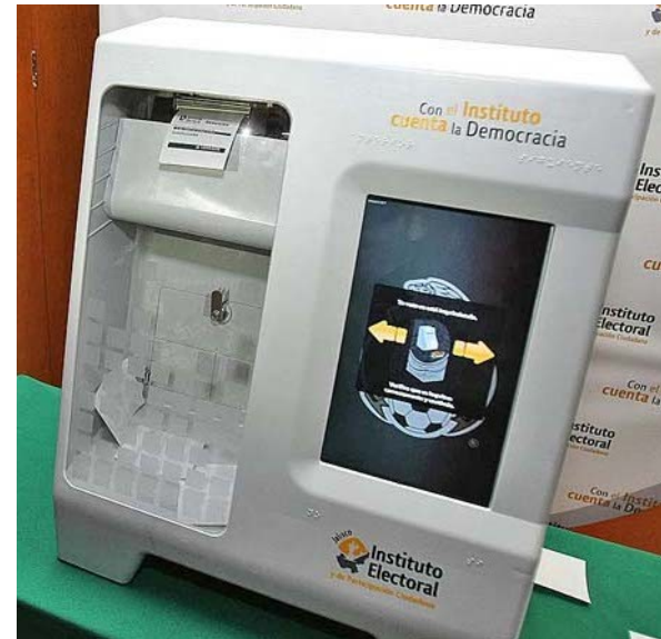
Urna VVPT México, 2005