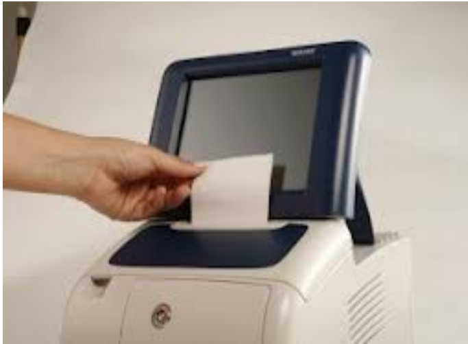
Urna VVPT Venezuela, 2004