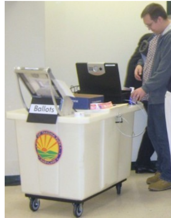
Urna E2E Estados Unidos (Scantegrity), 2009

www.brunazo.eng.br/voto-e/textos/modelosUE.htm