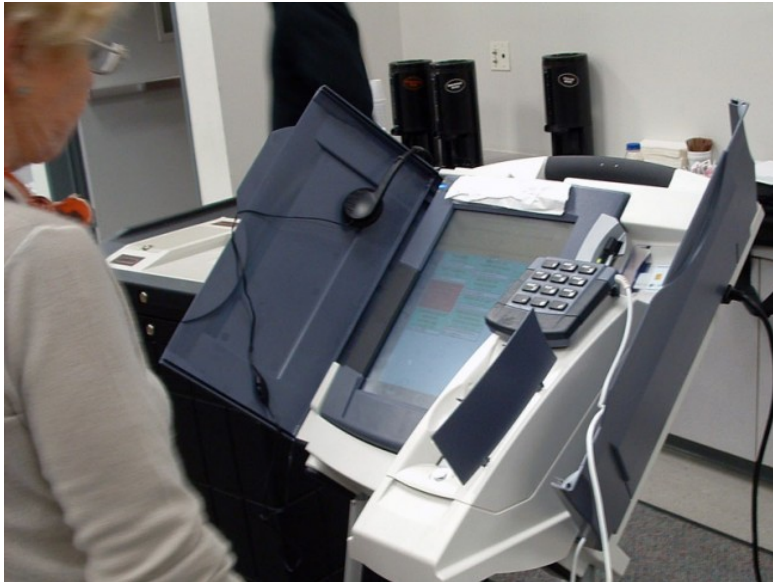
Urna DRE holandesa, 1991