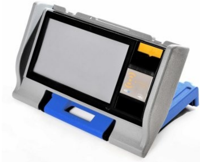
Urna E2E Argentina (VotAR), 2006