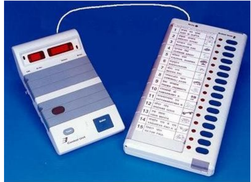
Urna DRE Indiana, 1992

http://www.brunazo.eng.br/voto-e/textos/modelosUE.htm