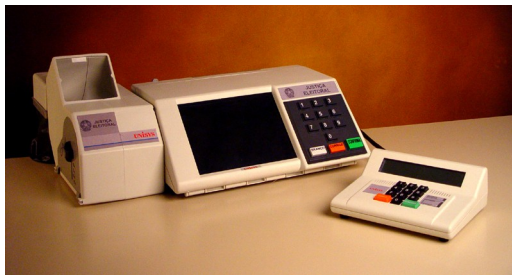
Urna VVPT Brasil 2002

www.brunazo.eng.br/voto-e/textos/modelosUE.htm